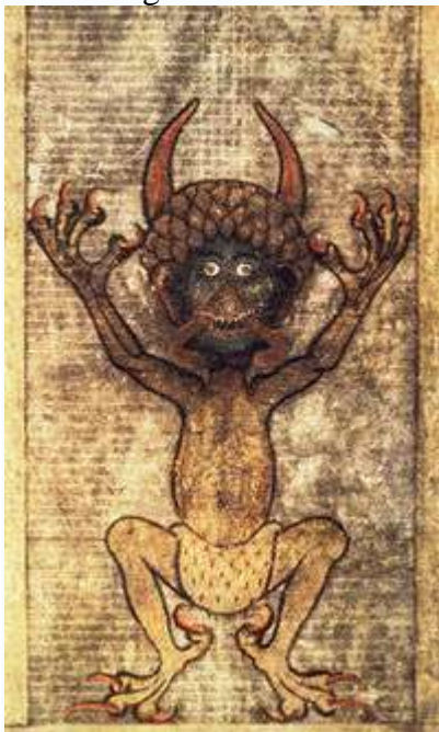
Kodex Gigas - vyobrazení ďábla

Kodex Gigas je svázan v dřevěných deskách potažených světlou kůží, opatřených kovovým zdobením. Rozměr desek je 920×505×220 mm. Původně obsahoval 320 pergamenových listů (tj. 640 stran) o velikosti 890×490 mm. Osm listů bylo vyříznuto, není známo kdy, kým a proč. Odstraněné listy pravděpodobně obsahovaly řeholní pravidla benediktinského řádu . Hmotnost celého kodexu je 75 kg, na výrobu potřebného pergamenu byly spotřebovány kůže 160 oslů .